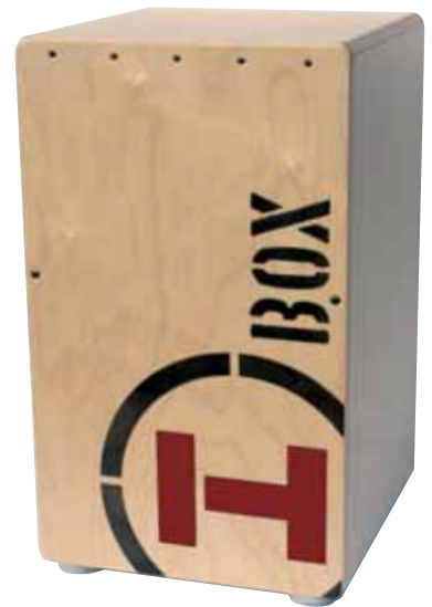
Snare Cajon H Box black/red Best.-Nr.: HB1 002 EUR 159,00 UVP