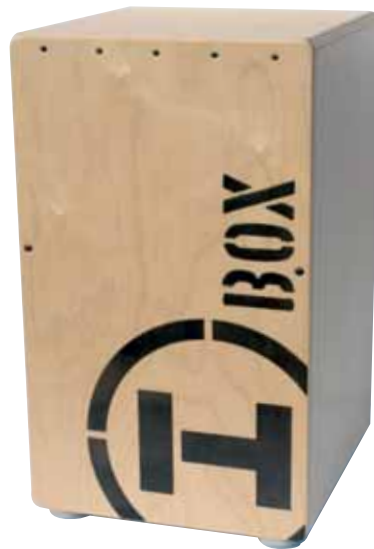
Snare Cajon H Box black Best.-Nr.: HB1 001 EUR 159,00 UVP